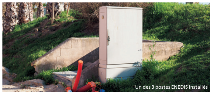
Un des 3 postes ENEDIS installés

Des postes ENEDIS sont en cours d'installation place de la République, place de la Liberté et sur le parking de la plage des Marines afin de répondre à la demande croissante d'énergie sur ces secteurs. Le troisième coffret, à Cogolin plage, répondra aux besoins en consommation électrique de l'ensemble des animations estivales. À l'issue de ces derniers travaux, l'entreprise COLAS procèdera à la réfection du parking afin de résoudre les problèmes de poussière. Quant aux postes en cœur de ville, ils viendront remplacer ceux de l'ancienne maison de retraite, impactés par la destruction de cette dernière.