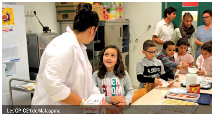
Les CP-CE1 de Malaspina