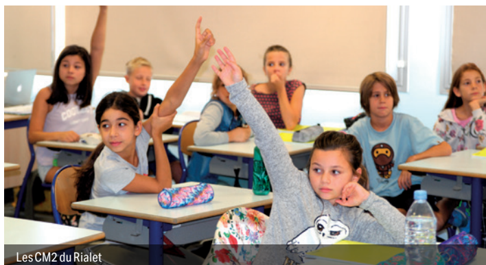
Les CM2 du Rialet

À l'occasion de la semaine du goût, les élèves de CP et CE1 de l'école Malaspina ainsi que les CM2 du Rialet ont découvert, le mardi 8 octobre au matin, les secrets d'une alimentation équilibrée.